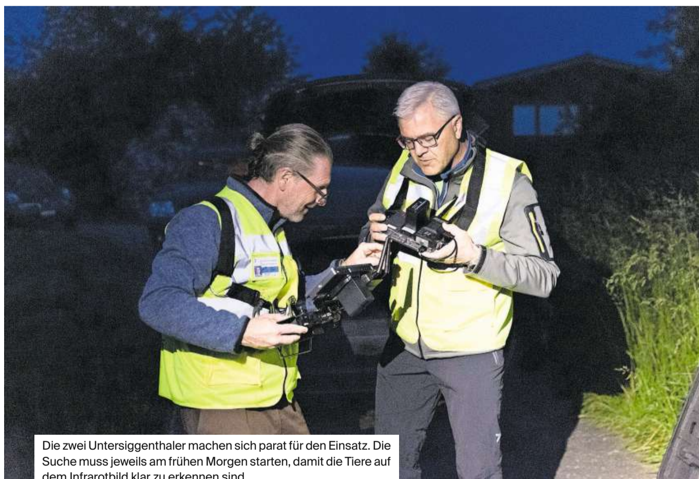
Die zwei Untersiggenthaler machen sich parat für den Einsatz. Die Suche muss jeweils am frühen Morgen starten, damit die Tiere auf dem Infrarotbild klar zu erkennen sind.