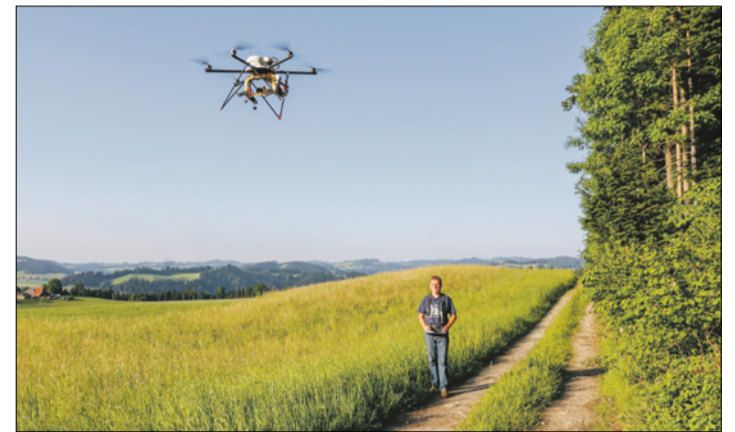
Damit die Rehkitze im Wärmebild erkennbar sind, müssen die Drohnenflüge frühmorgens stattfinden.

Auch in diesem Jahr werden sich die ehrenamtlichen Piloten und Pilotinnen in ihrer Freizeit für das Wohl der Rehkitze ein-